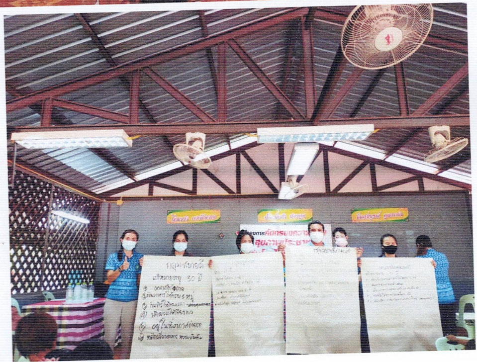
ภาพกิจกรรมโครงการ คัดกรองความเสี่ยงสุขภาพประชาชนกลุ่มโรคไม่ติดต่อเรื้อรัง หมู่ที่ ๖-๑๕ ตำบลนาหว้า ปี ๒๕๖๕ ณ ศาลาสร้างสุขอุนยางคำ